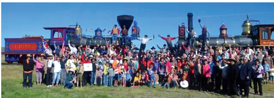
2019年将迎来美国修建第一条横贯东西大陆铁路150周年“金钉节”纪念。