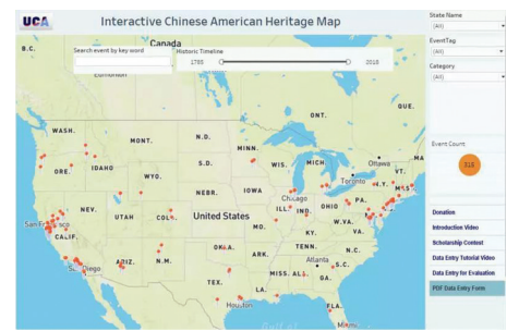
美国华人史迹互动地图项目

举办的“华人父母，美国孩子”论坛，以及2018年举办的关于“校园反霸凌”论坛。该计划针对亚裔心理健康，解决华人代际情感需求和心理问题。以此次大会为契机，把从波士顿、纽约到华盛顿特区美国东海岸一带关注华人心理健康的专家、社工和学生聚集一堂、连成一线，形成一个有效交流的网络，为进一步改善华人心理健康打下良好基础。