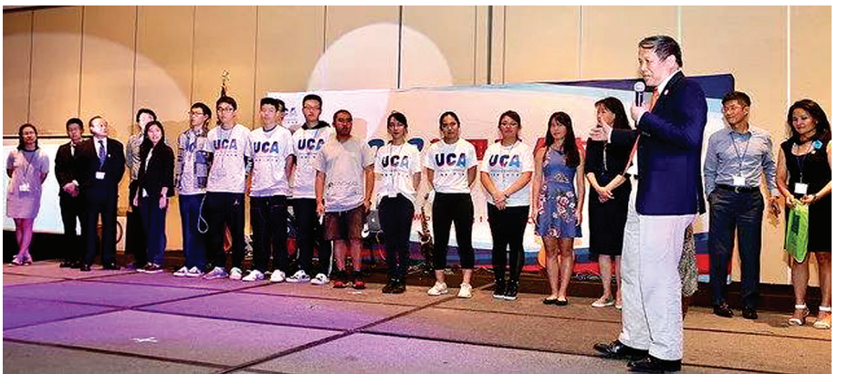
UCA 关心青年志愿服务和社区公益