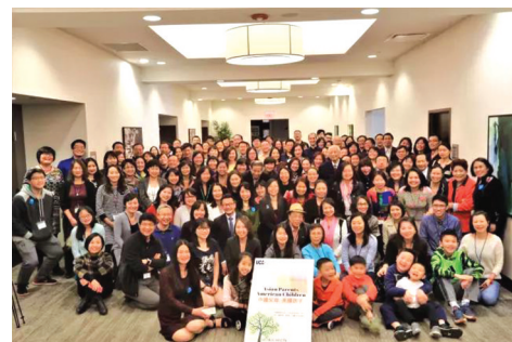
关心UCA青少年心理健康计划